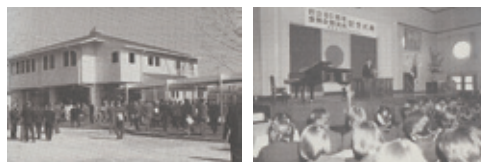
昭和51(1976)年 創立80周年記念式典