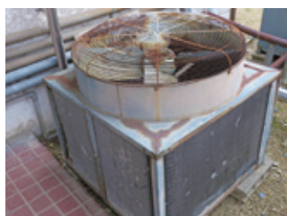
1階食堂エアコン室外機